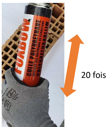
2. Agiter énergiquement 20 fois