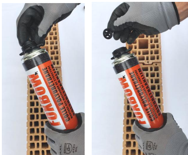
1. Oter la capsule