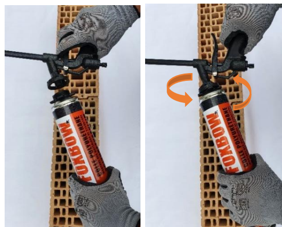
3. Visser le pistolet applicateur et régler le débit à l'arrière du pistolet